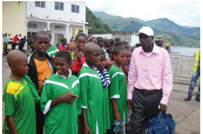
Ils visitent le port de Mutsamudu