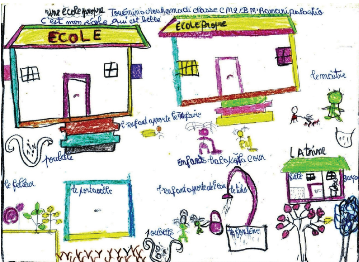
Illustration de Touemina, élève de Mramani, classe CM2

Un concours école propre est lancé dans toutes les écoles de l'île. Chacun de nous dessine comment sera son école