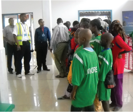
Les enfants visitent l'aéroport d'Ouani

N ous, les élèves de l'École Communautaire Maecha, avons effectué, une sortie pédagogique. Ce jour là, nous étions très contents.