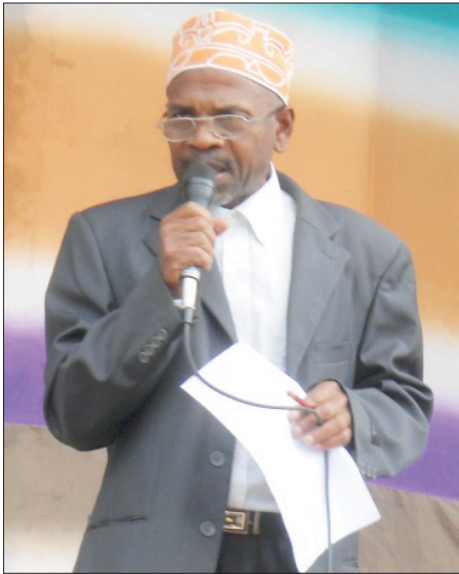
La proclamation des résultats par Mr Le Conseiller pédagogique de Magnassini

L'année est très bien passée. Parce qu'il n'y avait pas de grèves les enseignants ont toujours été dans les classes car ils sont régulièrement payés. Moi je suis un élève de l'École Maecha, j'étais en classe de CM1. Mais j'étais sélectionnée pour me présenter à l'examen d'entrer en 6ème. J'ai réussi. Dans mon école nous étions 15 élèves sélectionnés pour aller faire l'examen, 9 sont admis les 6 restants sont admis en CM2. Alors nos enseignants se félicitent et ils nous ont dit qu'ils sont très contents de notre travail.