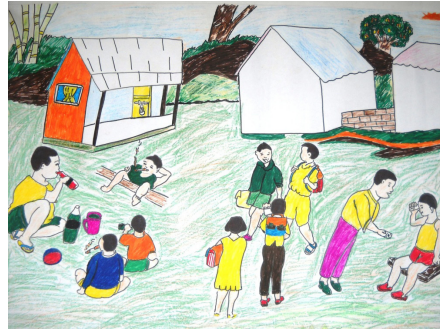
Méfions-nous de l'alcool et de la cigarette