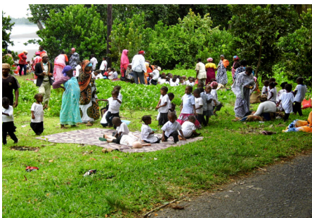
Repos des enfants après la visite de la plage

Chaque année, les enfants des classes maternelles font une sortie pédagogique pour visiter des lieux et des endroits qu'ils n'ont jamais vus. Dans mon village à Magnassini il y a aussi des classes maternelles. Le jour de la sortie, ma mère m'a dit que c'est moi qui allais partir en voyage avec mon frère. Il y avait beaucoup de parents qui ont accompagné leurs enfants. Les monitrices nous ont expliqué que ce jour-là, les enfants allaient visiter la plage et le tunnel de Moya.