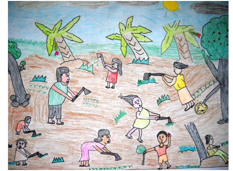
Ne nous exploitez pas s'il vous plaît

ZamZam aime un autre homme appelé Djoundi. C'est le garde du corps du roi. Lorsque le roi est informé de la décision de sa fille de vouloir épouser Djoundi, il a décidé de