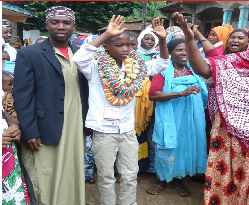
L'accueil de l'élève ambassadeur de l'École