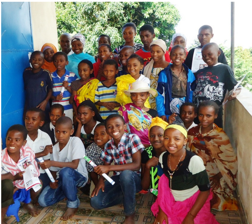
L'équipe de la rédaction