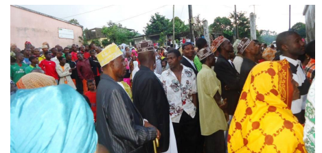
L'assistance lors de la venue du président de l'assemblée au village