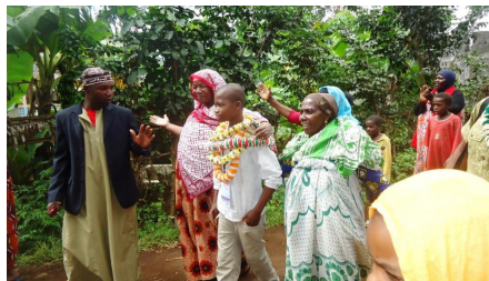
L'ambassadeur de l'ECMA rentre chez lui accompagné de ses parents

Après le festival scolaire, un autre concours appelé concours franco-jeune est lancé dans l'Océan Indien. C'est un concours d'histoires. Il concerne les écoles primaires, les collèges et les lycées de l'Océan Indien. Mes amis et moi avons raconté nos histoires qui sont envoyées à Mayotte pour être corrigées. Dans notre école, c'est la mienne qui est choisie. Le titre de mon histoire est : «ZAMZAM et le Gri Gri » Elle parle d'un mariage forcé d'une fille d'un roi appelée ZamZam avec un sorcier appelé Zangué.