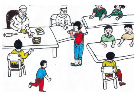
Illustration du dépistage des enfants dans les écoles, par Amroine d'Adda, classe

Au mois d'avril passé, des médecins étaient passés dans toutes les écoles du Nyumakele pour visiter les enfants. Dans mon école, c'était le 14 avril. Notre directrice nous avait dit que les élèves qui ont des problèmes de la peau, ou qui ont perdu une partie des cheveux, seront visités et traités. Dans notre classe, il y avait beaucoup d'élèves qui avaient ces problèmes. Le docteur fait la visite puis donne le médicament sur place et les autres remèdes, on les emporte à la maison pour continuer le traitement. Tout le monde doit boire trois comprimés. Il y a des camarades qui laissent le médicament dans la bouche parce qu'ils n'aiment pas les médicaments. Après la récréation ils vont le jeter.